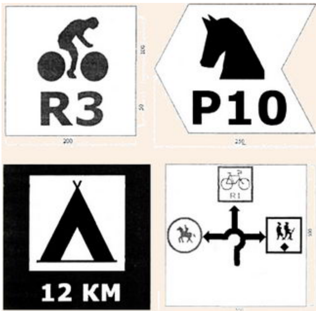
Рис. 8.2. Зразки туристичних знаків на місцевості, якими обладнуються туристичні маршрути (R3, P10 - коди міжнародних та загальнодержавних туристичних маршрутів, описаних і затверджених у відповідних реєстрах)

Туристичні знаки на місцевості, в основному, мають форму геометричної фігури, на яку наносяться відповідних кольорів фон і марка, а також додаткова інформація - кольором марки або чорним кольором (рис. 8.2):