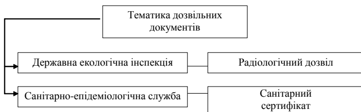
Рис. 4.1. Дозволи державних органів України, необхідні для експорту сухого молока.

Основна тематика дозвільних документів державних органів, необхідних для митного оформлення сухого молока, наведена на рис. 4.1.